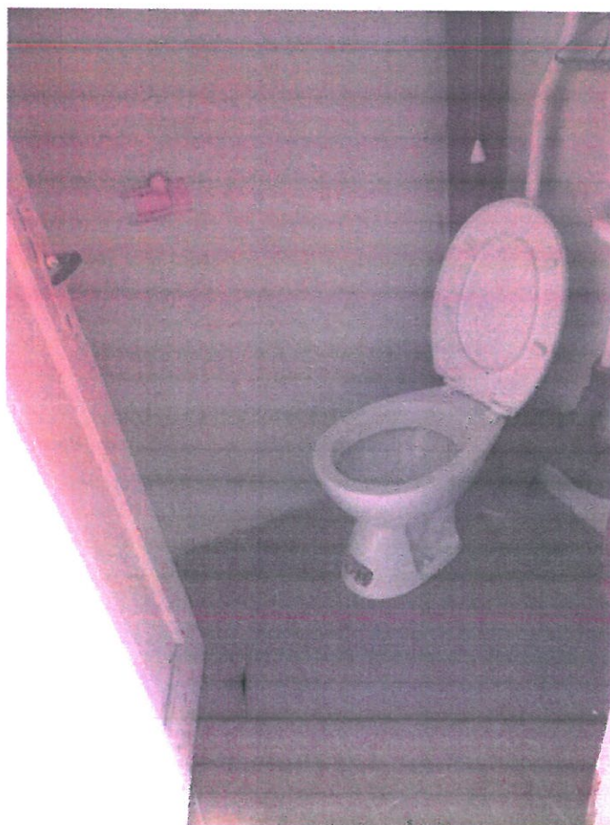
WC (część wspólna) – strona północna od podwórza