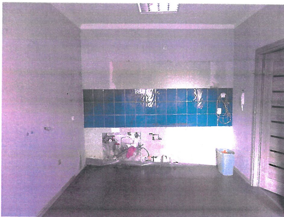
Pomieszczenie nr 1