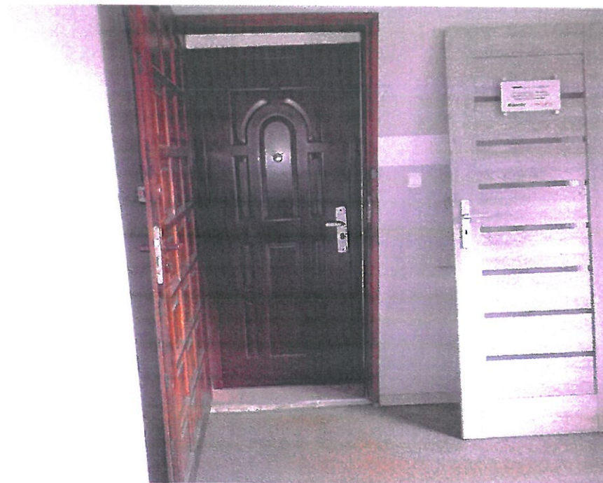
Pomieszczenie nr 3