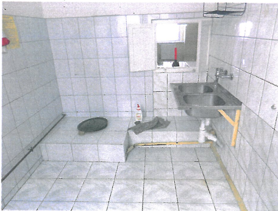
Pomieszczenie nr 5