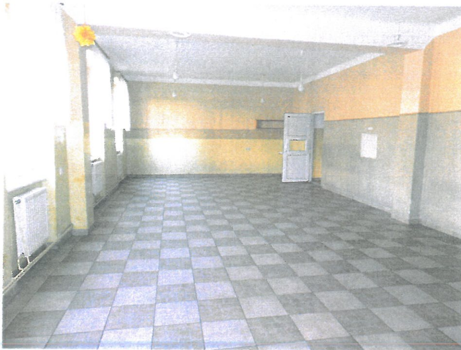
Pomieszczenie nr 10