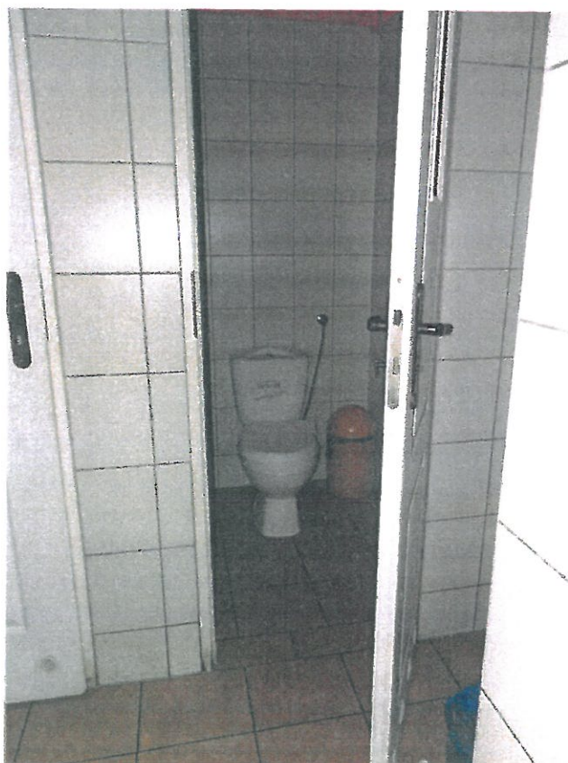
WC nr 7