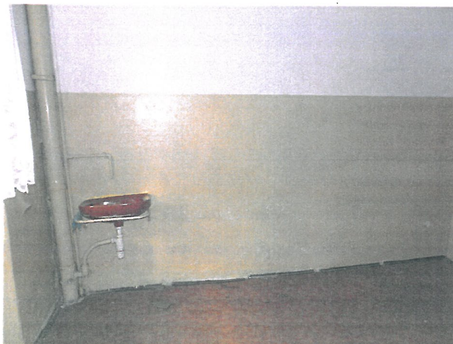
Pomieszczenie nr 13