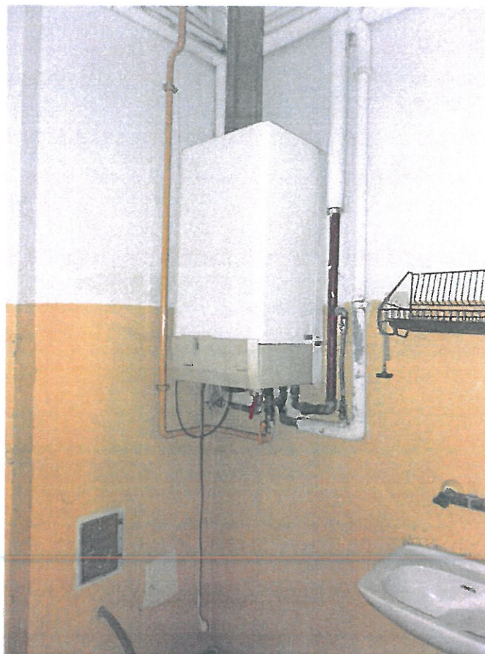
Pomieszczenie nr 1