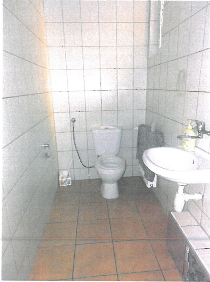
WC nr 6