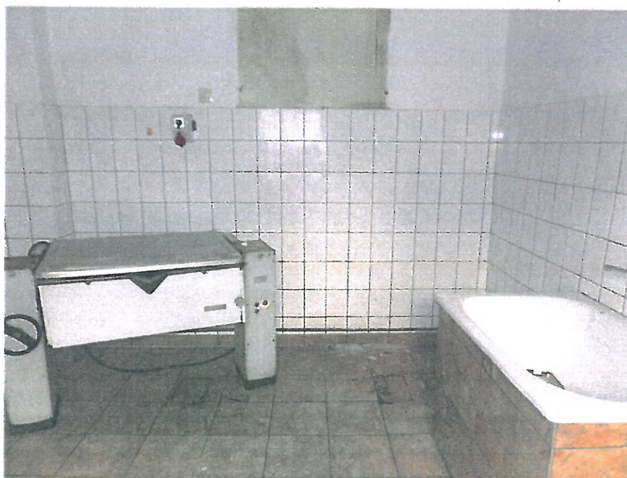
Pomieszczenie nr 3