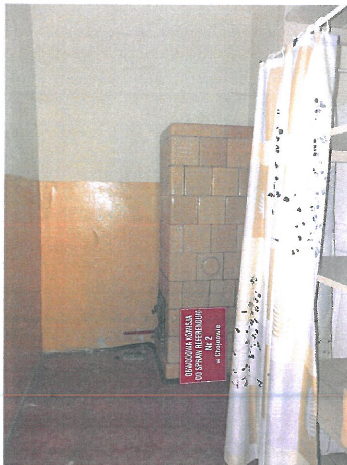
Pomieszczenie nr 14 przynależne