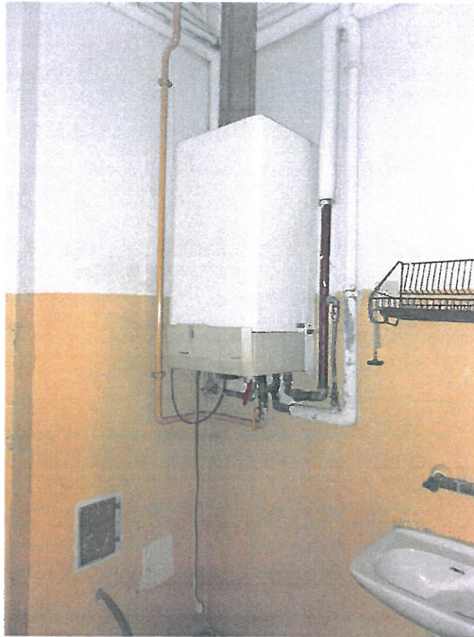
Pomieszczenie nr 1