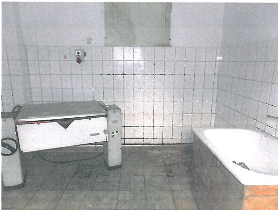
Pomieszczenie nr 3