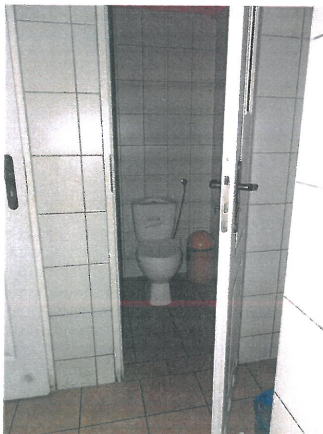
WC nr 7