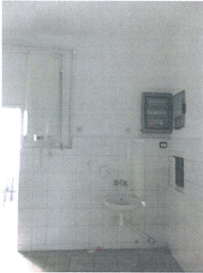
Pomieszczenie nr 4