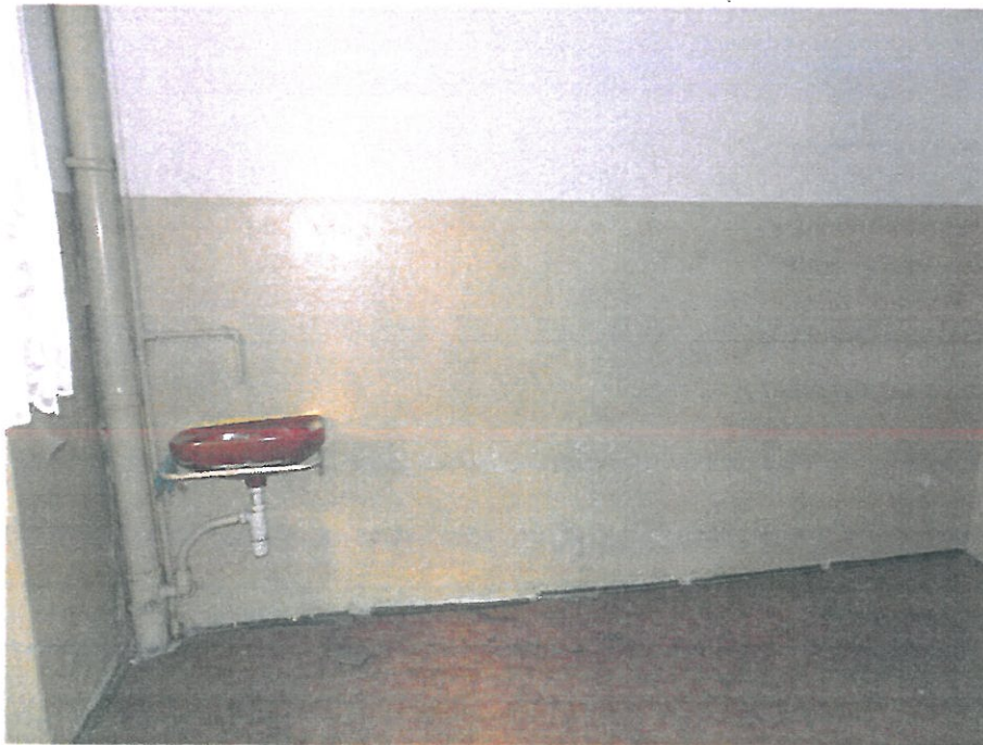
Pomieszczenie nr 13