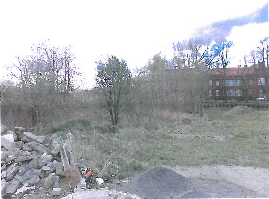
Widok działki nr 224/4 od strony północnej