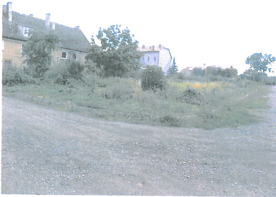
Widok działki nr 330/12 od strony skrzyżowania ul. Ogrodowej i Reymonta