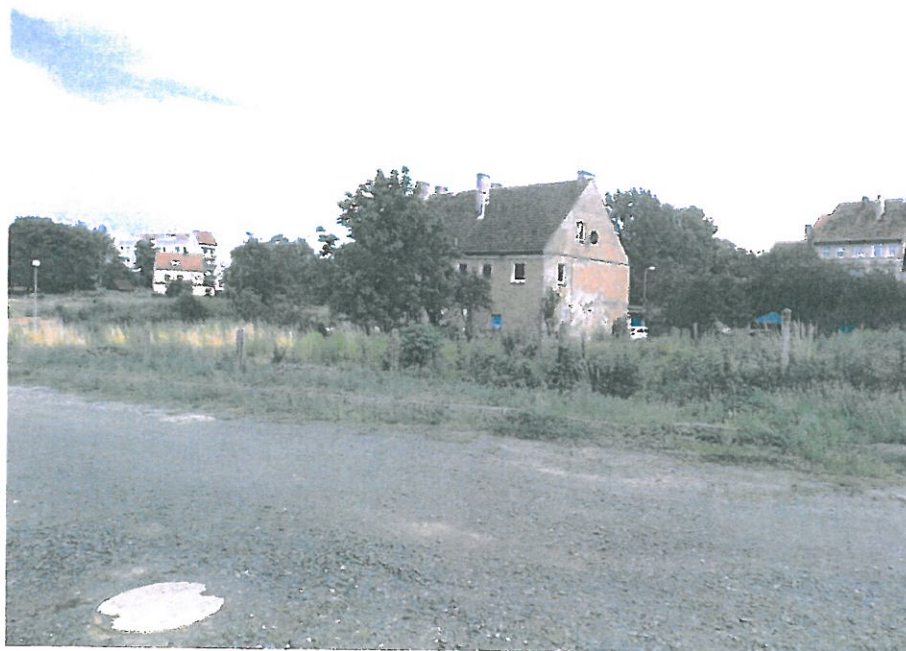
Widok działki nr 330/12 od strony skrzyżowania ul. Reymonta