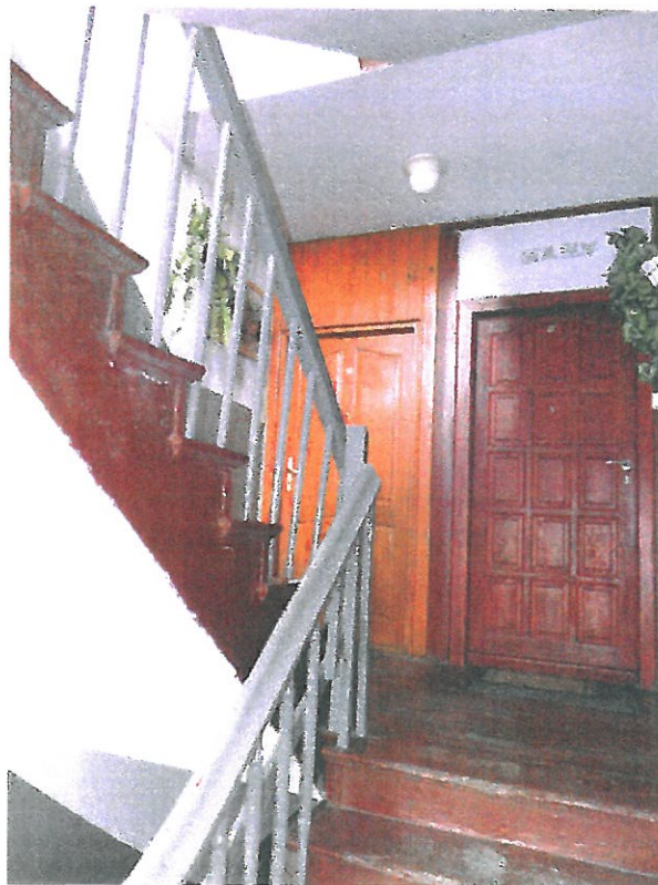
Widok klatki schodowej