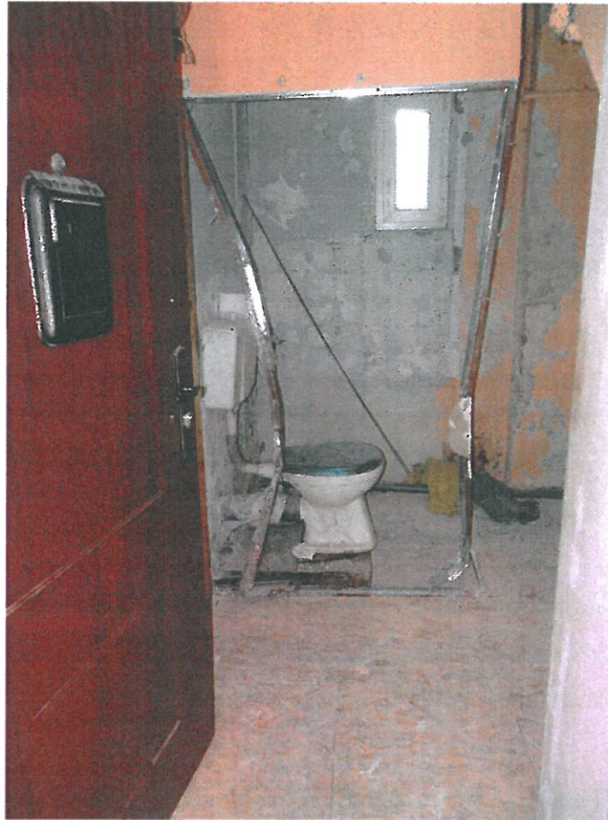
Przedpokój i wc