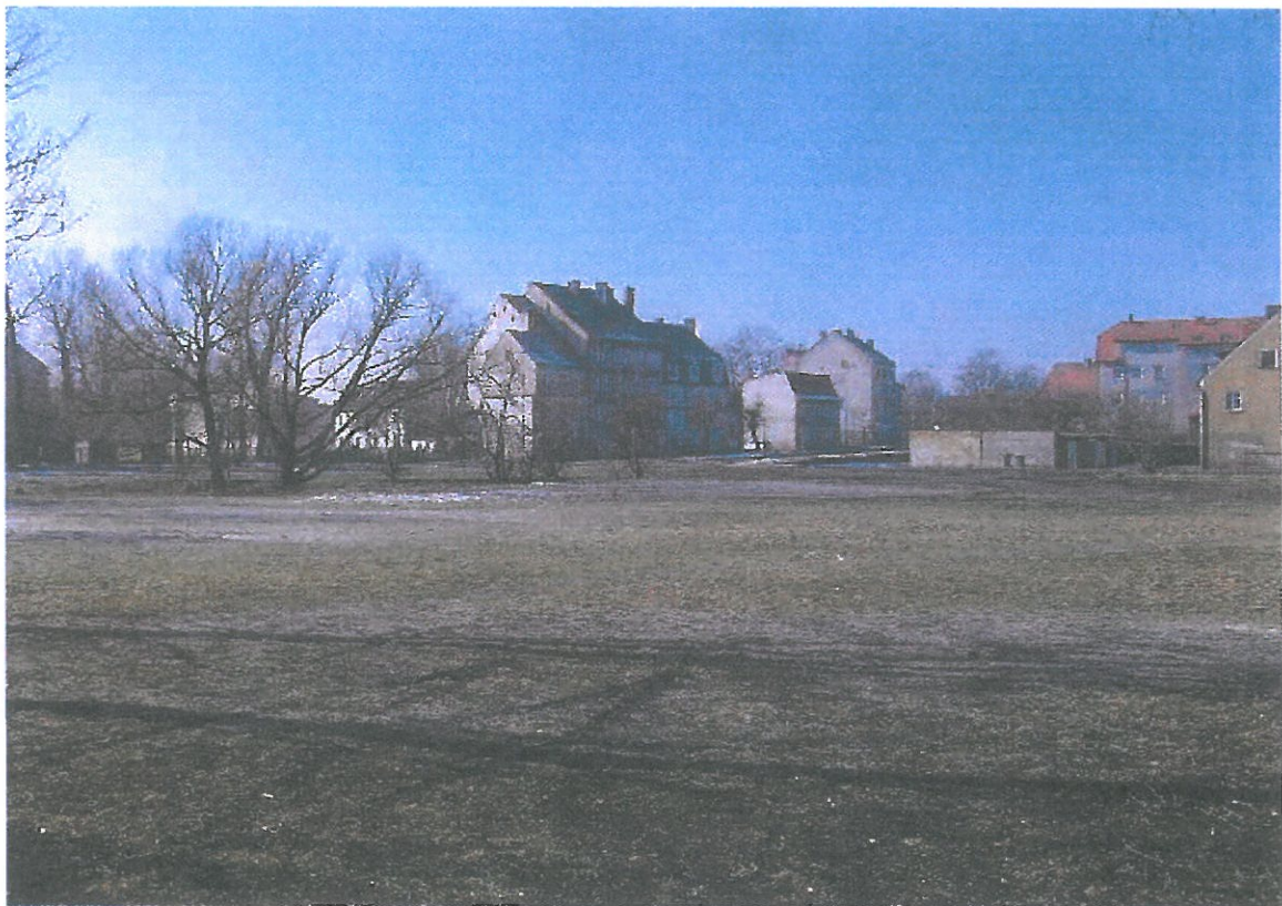
Widok działki nr 460/5 od strony północno - wschodniej