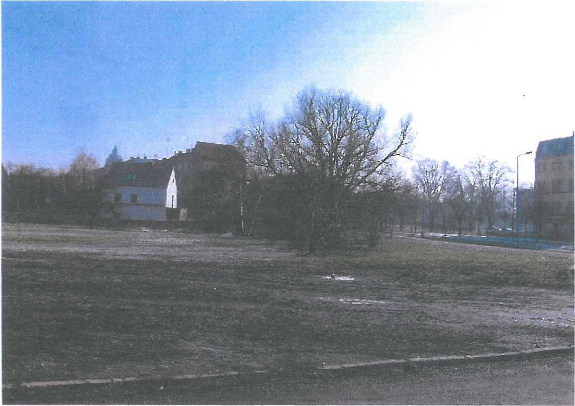
Widok działki nr 460/5 od strony zachodniej