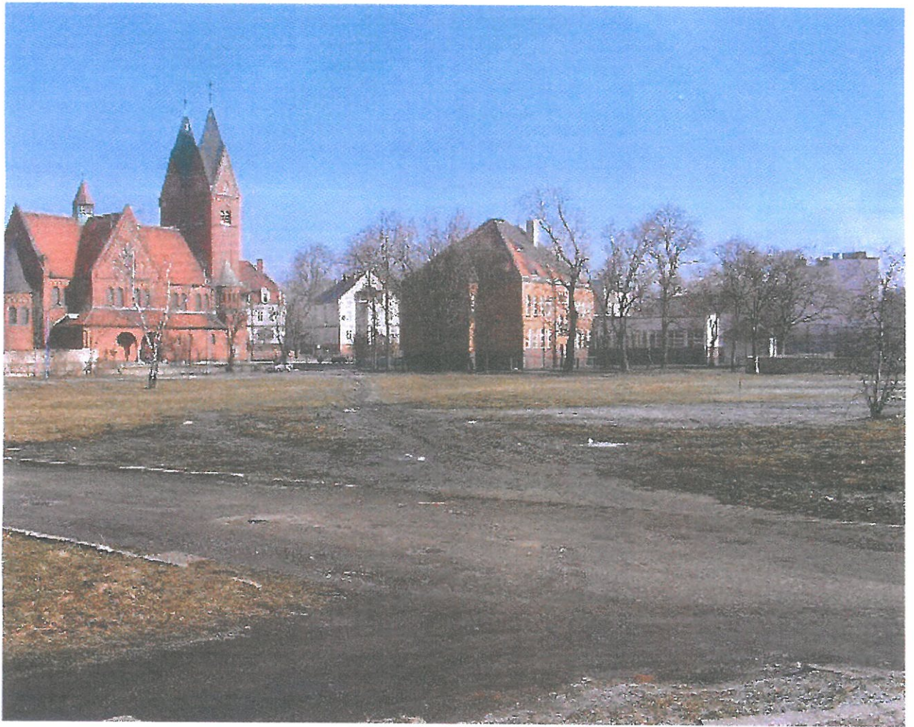
Widok działki nr 460/5 od strony południowo – zachodniej