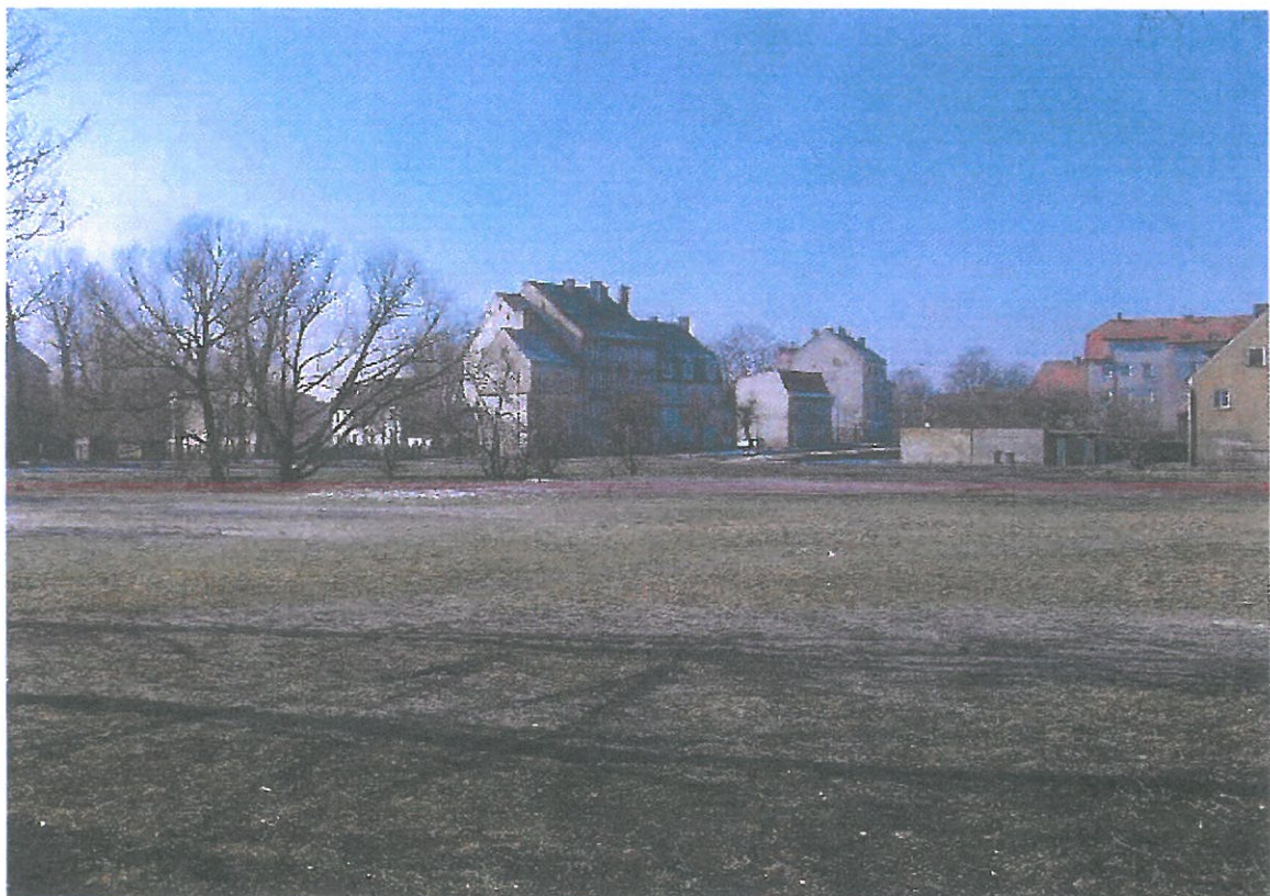
Widok działki nr 460/5 od strony północno - wschodniej