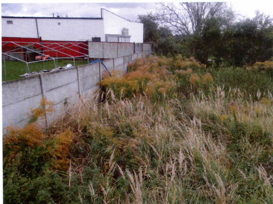
Widok działki nr 224/3 od strony zachodniej