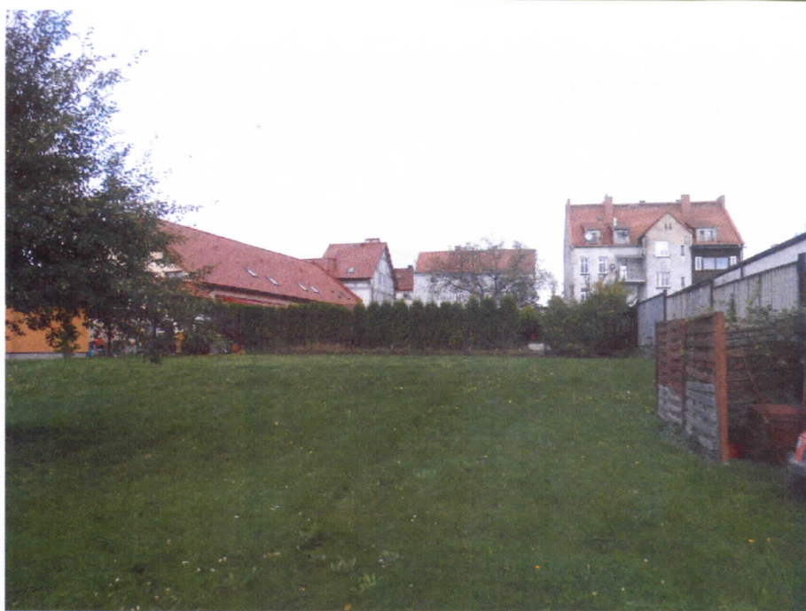
Widok działki nr 224/8 od strony południowej