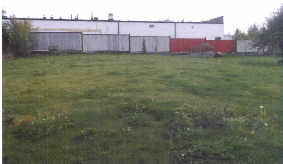
Widok działki nr 224/8 od strony zachodniej