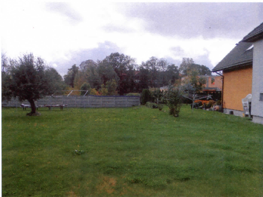
Widok działki nr 224/8 od strony północnej