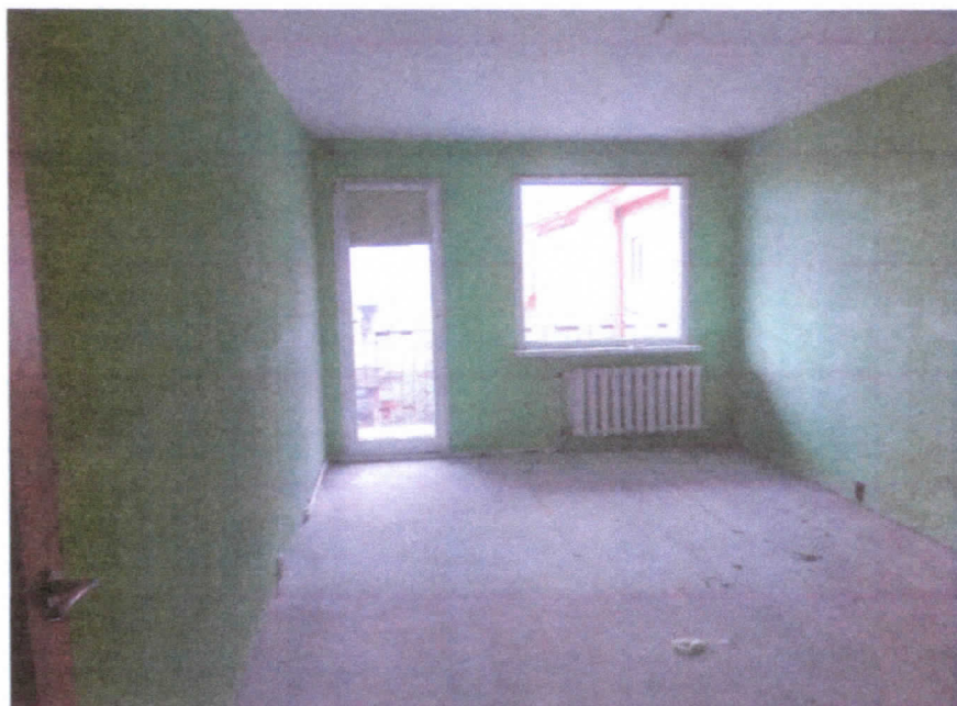
Pokój nr 2

Wzrost: 1,70 m Ciężar ciała: 65 kg Ciężar ciała: 65 kg Ciężar ciała: 65 kg