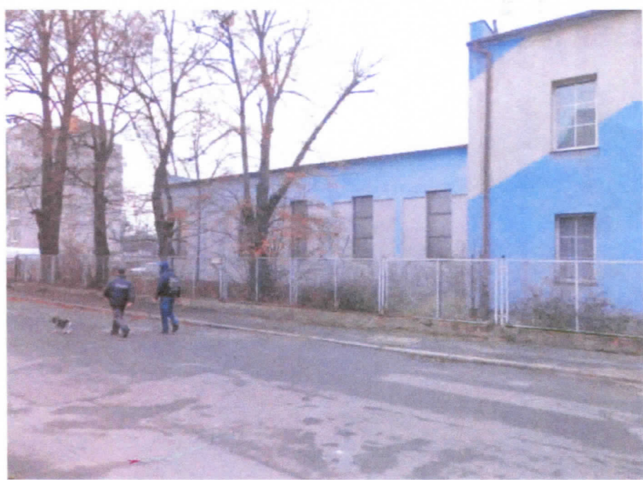
Widok budynku od strony ul. Złotoryjskiej