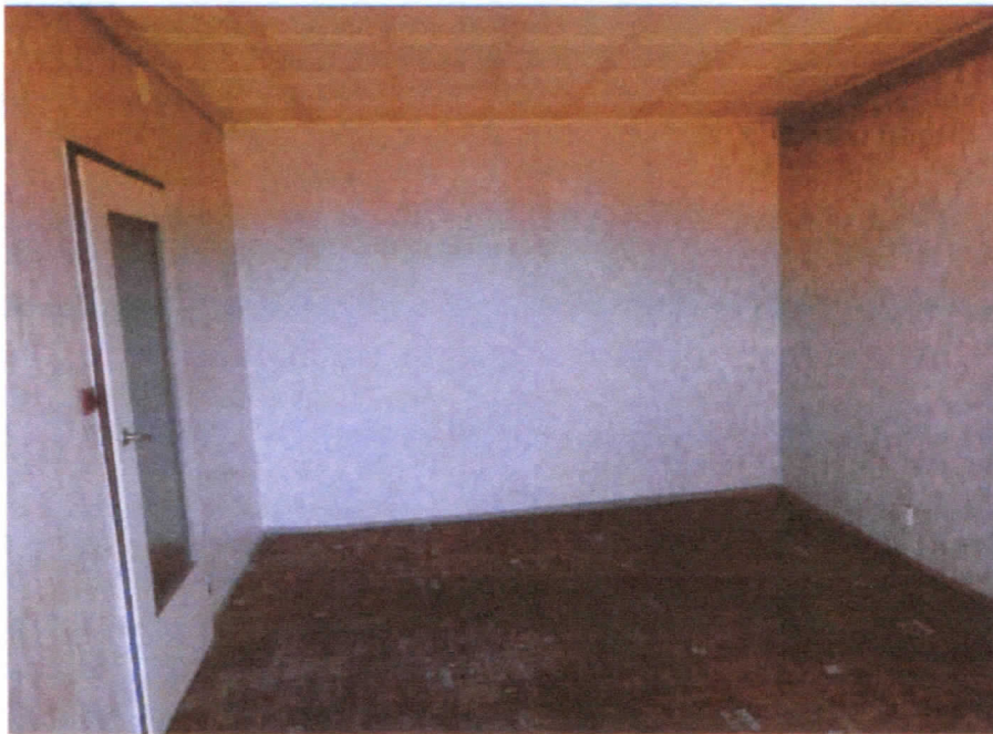
Pokój nr 103