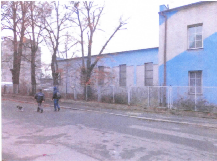
Widok budynku od strony ul. Złotoryjskiej