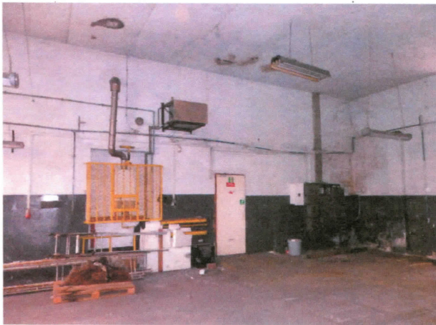
Piec gazowy z dmuchawą i układ elektryczny

15.02.2015 r. 15.02.2015 r. 15.02.2015 r.