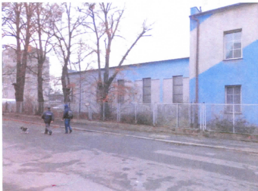
Widok budynku od strony ul. Złotoryjskiej