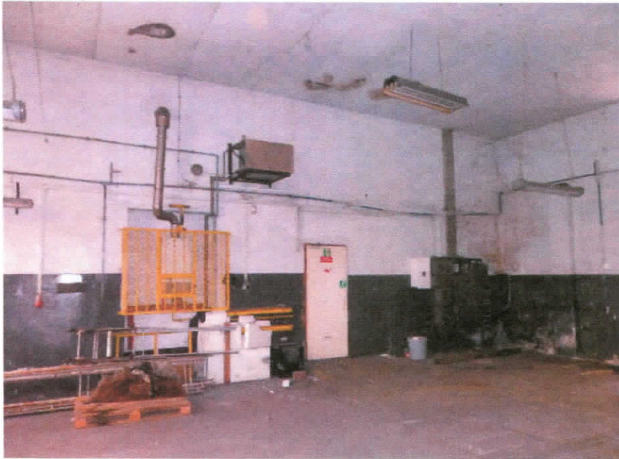
Piec gazowy z dmuchawą i układ elektryczny