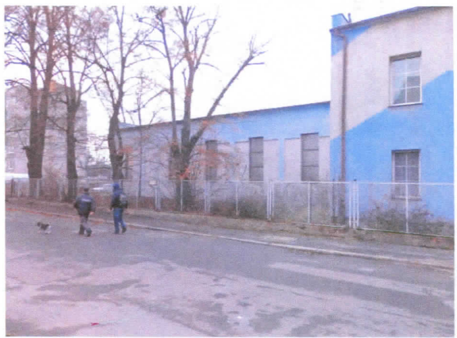
Widok budynku od strony ul. Złotoryjskiej