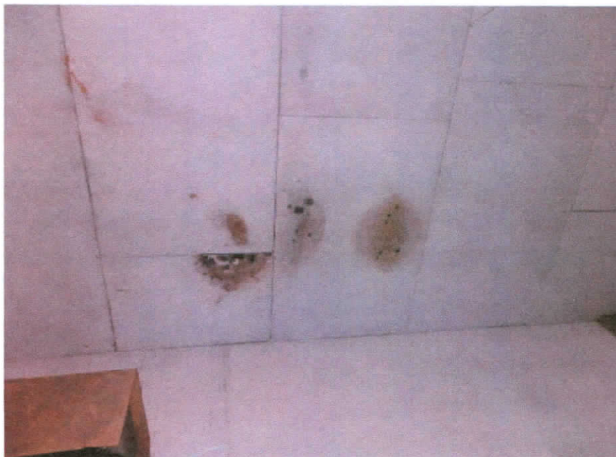
Zacieki na suficie