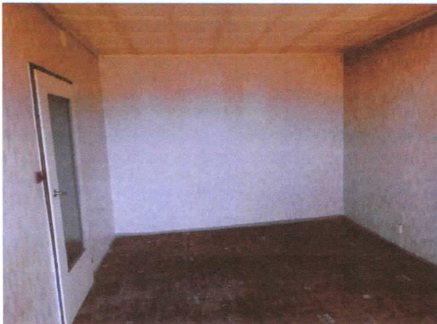
Pokój nr 103