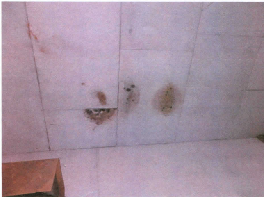
Zacieki na suficie