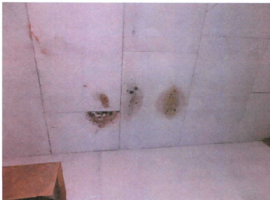
Zacieki na suficie