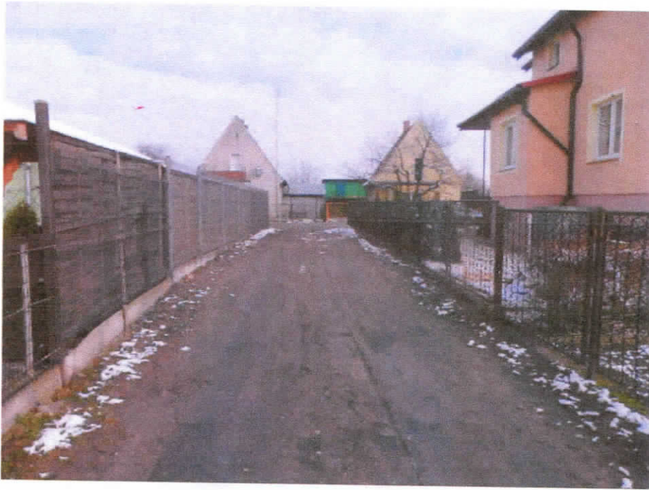
Widok działki nr 471/2 od strony zachodniej.