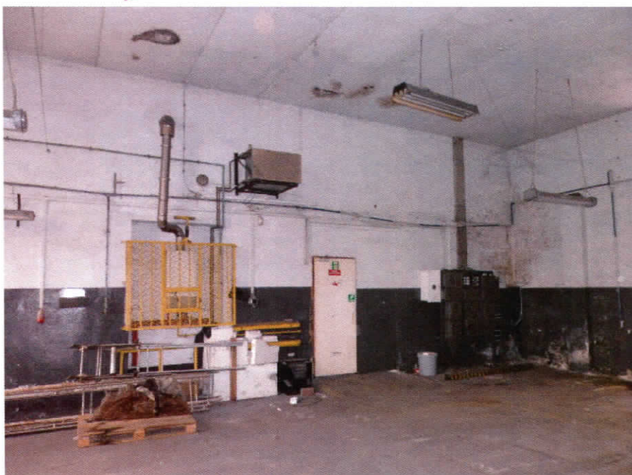
Piec gazowy z dmuchawą i układ elektryczny