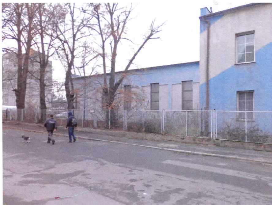
Widok budynku od strony ul. Złotoryjskiej