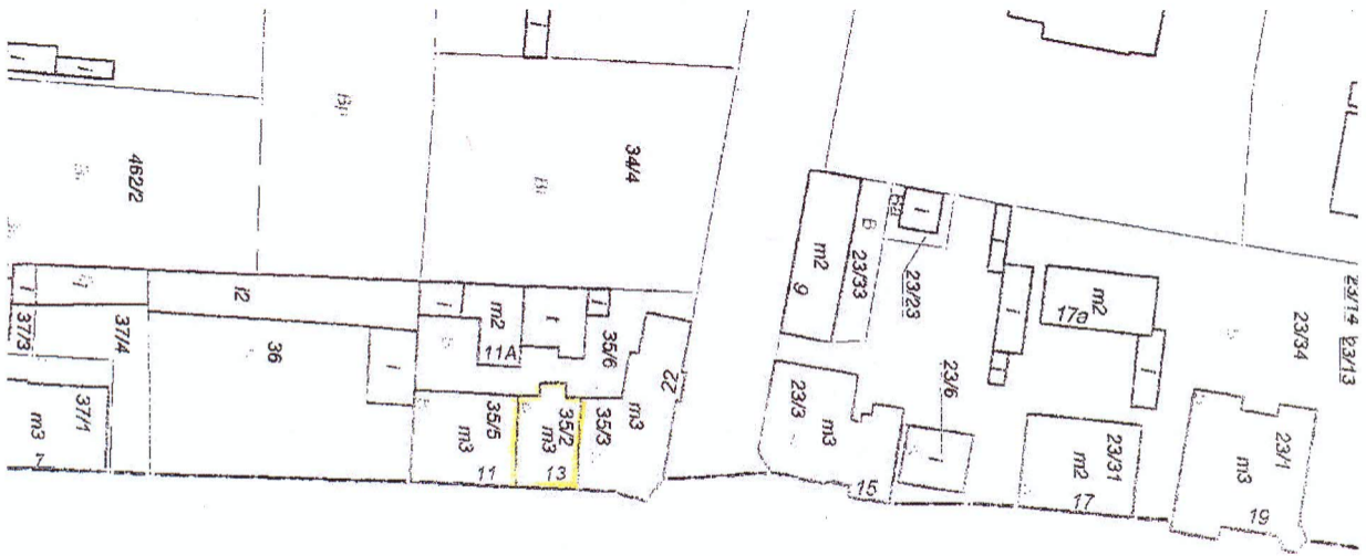
Działka nr 35/2 na mapie ewidencji gruntów